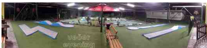
Overzicht van de baan in Ostrava.