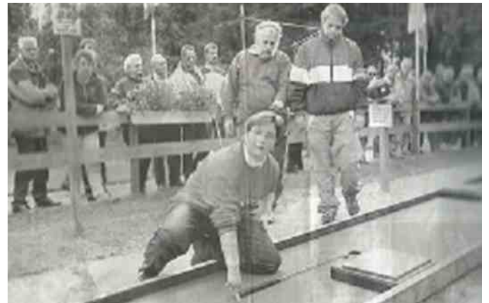
Een beeld van wedstrijd, waarbij fel om de punten werd gestreden.