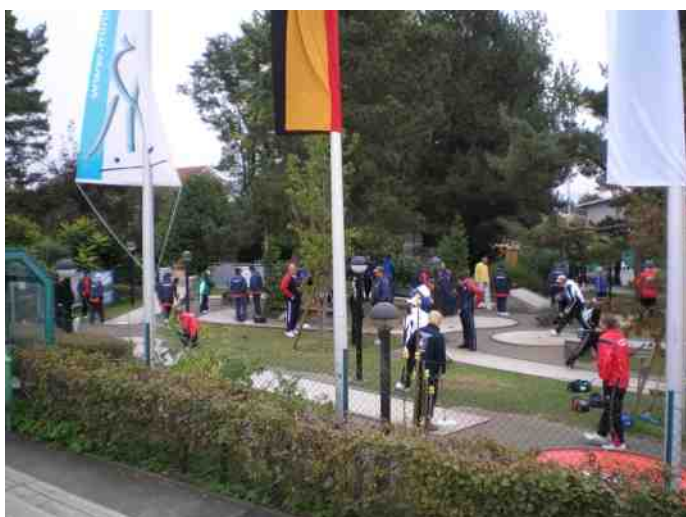
Overzicht van de baan in Hilzingen.