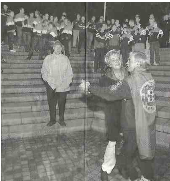
Bij de openingsceremonie werd al gedanst door spelers en supporters.

De succesvolle organisatie van 1990 was de aanleiding om ter gelegenheid van het 35 jarig bestaan van M.G.C. Appelscha opnieuw ons kandidaat te stellen voor de organi-