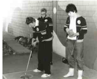
De dames actief tijdens de training op de indoor baan in Basserdorf.

Dit toernooi voor de Europa Cup 1983 werd gespeeld op 6 en 7 januari 1984. Voor dit toernooi vertrokken de dames met coach Klaas Rozeveld en chef d'équipe Douwe van der Zee op maandag 2 januari met het vliegtuig naar Zwitserland, zodat de dames op dinsdag t/m donderdag konden trainen op deze voor hen nieuwe banen. Op vrijdag 6 januari werden er vier ronden gespeeld en de vier dames teams, die hierna op eerste 4 plaatsen staan spelen op zaterdag