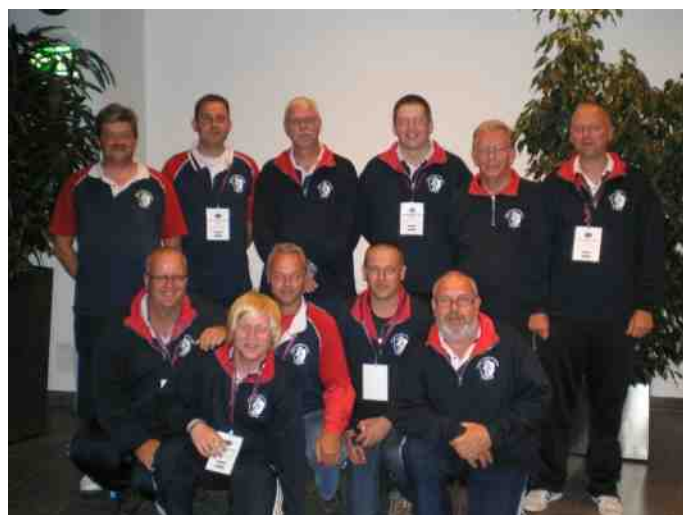
Onze vertengewoording in Vaduz Liechtenstein.